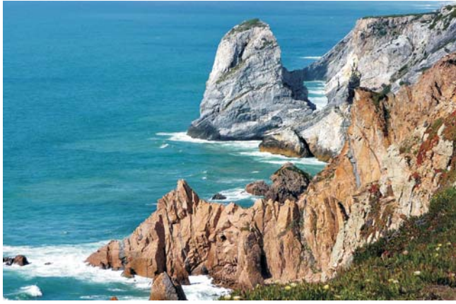
Blick auf die Atlantikküste am Cabo da Roca