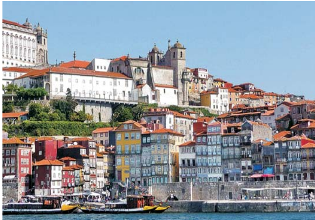
Blick vom Fluss Douro auf die Altstadt von Porto

Beachtung der schönen Landesnatur nicht zu kurz kommen. Intensiv erleben Sie einige der schönsten Naturlandschaften Portugals inklusive einiger schöner Spaziergänge: die Küste der Algarve und des Atlantiks, die Flusslandschaften des Douro (mit einer mehrstündigen Schifffahrt im schönsten Flussabschnitt) und des Tejo, die Estremadura sowie die Gebirgsländer der Serra de Estrella, des Nationalparks Serras de Aire und des Alentejo. Die Reisezeiten im Frühjahr und Frühherbst sind im klimatisch vom Atlantik beeinflussten Portugal ideal. Ein weiteres Plus der Reise ist die abwechslungsreiche Unterbringung in hübschen Hotels einmal am Meer, auf dem Lande und inmitten der historischen Altstädte, so dass Sie das besondere Flair der portugiesischen Städte, insbesondere Lissabons und Portos, auch wirklich hautnah erleben und genießen können.