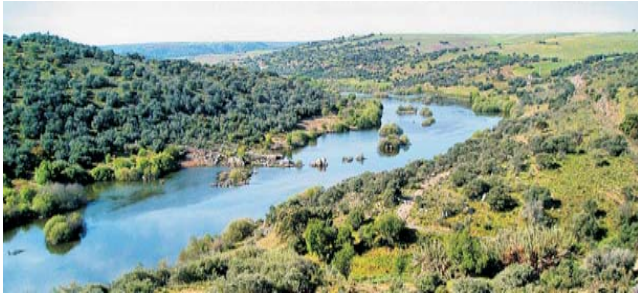
Der Fluss Guadiana in der Nähe von Serpa

Nach der Anmeldung zu dieser Reise wird mit der von GEOPULS zugesandten Buchungsbestätigung eine Anzahlung (15 % des Reisepreises) fällig. Die Restzahlung erfolgt zwei Wochen vor Reisebeginn. Es gelten die Geschäftsbedingungen des Veranstalters: Geopuls GbR, Neckarhalde 62, 72108 Rottenburg (Tel. 07472-9808802). Bitte beachten Sie vor Reisebuchung unsere Allgemeinen Reisebedingungen sowie das Formblatt zur Unterrichtung des Reisenden bei einer Pauschalreise nach § 651a des BGB (EU-Richtlinie 2015/2302). Beides schicken wir gerne vor Buchung zu oder kann auf/von der Geopuls-Homepage eingesehen oder ausgedruckt werden. www.geopuls.de