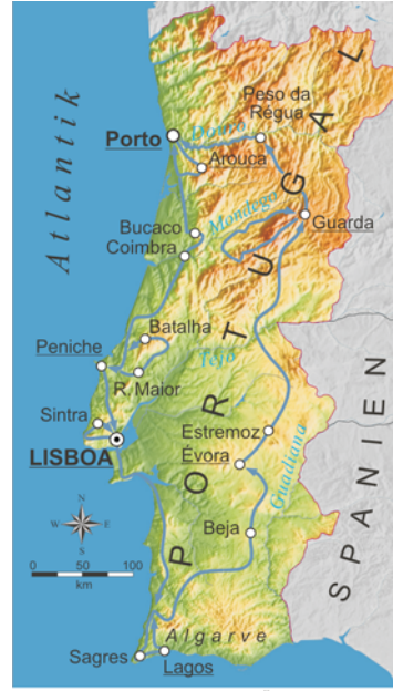
Geopuls-Route, unterstrichen = Übernachtungsorte