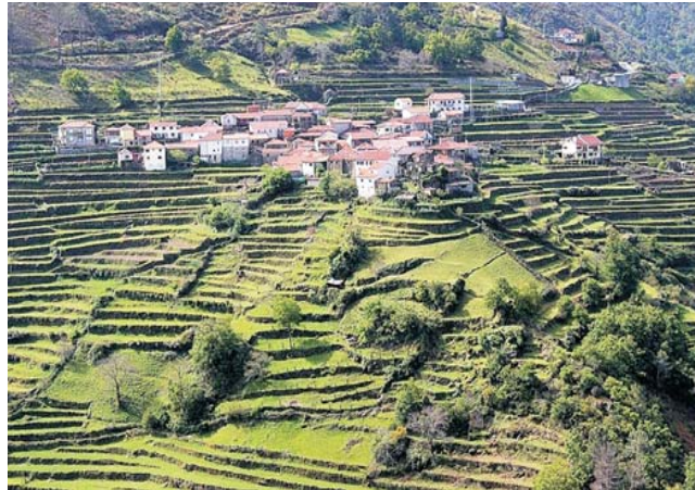
Terrassenlandschaft im äußersten Norden Portugals um Sistelo

Die Exkursion führt von den Flachlandschaften und Hügelländern im Westen über die Gebirgszüge des äußersten Nordens mit dem Nationalpark Peneda-Geres zu den Hochplateaus des Nordostens, die von zahlreichen reizvollen Flusstälern zerschnitten werden. So ursprünglich und vielfältig das Land, so alt ist der geologische Unterbau mit Graniten aus dem Erdaltertum die zu den ältesten Gesteinen Europas zählen. Einen einmaligen Reiz hat an vielen Orten das Verschmelzen der daraus errichteten Bauwerke mit ihrer natürlichen Umgebung. Auch die Art zu Wirtschaften schlägt sich überall in der Landschaft nieder und führt zu teils großartigen Anblicken, wie z.B. dem, mitunter an Tibet erinnernden Terrassenfeldbau bei Sistelo. Weitgehend unbekannte und dennoch beeindruckende Monumente liegen genauso auf unserer Route wie einige UNESCO-Welterbestätten: gleich zu Beginn eine Stippvisite mit Bootsfahrt im historischen Porto, die Wallfahrtskirche Bom Jesus do Monte in Braga, der Nationalpalast in Mafra, die prähistorischen Felszeichnungen im Vale do Coa und die Weinregion Alto Douro. Die eine oder andere Weinprobe ist natürlich eingeschlossen, genauso einige kleine, gut zu bewältigende Wanderungen (max 1-2 h reine Gehzeit), um die herrliche Natur auch hautnah zu erleben.