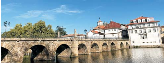
die Römerbrücke von Chaves über den Fluß Tamega

Komplettpreis pro Person im DZ: 2320 € , EZ +440 € Teilnehmerzahl begrenzt auf 16 Personen