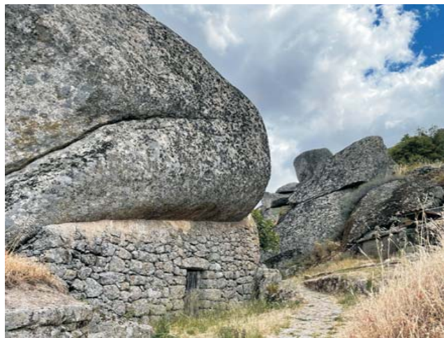
im Granit-Dorf Monsanto

dieser Folder wurde CO 2 - neutral hergestellt