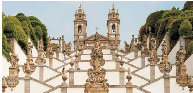
Bom Jesus do Monte in Braga

GEOPULS als Veranstalter für alle am Reisen interessierten Menschen, wurde 2004 von ehemaligen Dozenten des Geographischen Instituts in Tübingen, gegründet. Geopuls arbeitet seitdem mit der vhs zusammen. Begeisterte Geographen und Landeskundler, die Natur, Kultur und Hintergründe eines Ziellandes bestens vermitteln können, führen Sie bei diesen Exkursionen. Wir versuchen dabei, ein Land möglichst umfassend zu bereisen, was bedeutet, dass neben den berühmten Sehenswürdigkeiten auch die Landesnatur Beachtung und Erklärung findet. Kleine Wanderungen und Spaziergänge in die Natur bieten deshalb immer wieder eine schöne und interessante Abwechslung zum Kulturprogramm. Es gilt ein Land so authentisch wie möglich zu erleben und dabei auch die oft übersehenen kleinen Dinge zu entdecken. Dies funktioniert am besten in einer überschaubaren Gruppe, weshalb die Teilnehmerzahl bei dieser Reise auf 16 Personen begrenzt ist.