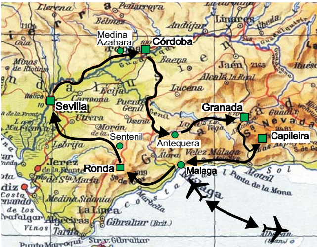
Geopuls-Exkursionsroute Andalusien ■ Übernachtungsorte ● sonstige wichtige Station