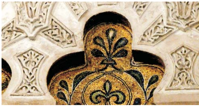
Detail Vielpassbogen im Mihrab der Mezquita, Córdoba

Nach der Anmeldung zu dieser Exkursion wird mit der von GEOPULS zugesandten Buchungsbestätigung eine Anzahlung (15% des Reisepreises) fällig. Die Restzahlung erfolgt zwei Wochen vor Reisebeginn. Es gelten die Geschäftsbedingungen des Veranstalters: Geopuls GbR, Neckarhalde 62, 72108 Rottenburg (Tel. 07472-9808802). Bitte beachten Sie vor Reisebuchung unsere Allgemeinen Reisebedingungen sowie das Formblatt zur Unterrichtung des Reisenden bei einer Pauschalreise nach § 651a des BGB (EU-Richtlinie 2015/2302). Beides schicken wir vor Buchung gerne zu, oder kann auf/von der Webseite www.geopuls.de eingesehen und ausgedruckt werden.