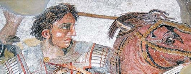
Detail aus dem Alexandermosaik im archäolog. Nationalmuseum zu Neapel

Nach Anmeldung zu dieser Reise wird mit der von GEOPULS zugesandten Buchungsbestätigung eine Anzahlung (15% des Reisepreises) fällig. Die Restzahlung erfolgt zwei Wochen vor Reisebeginn. Es gelten die Geschäftsbedingungen des Veranstalters: Geopuls GbR, Neckarhalde 62, 72108 Rottenburg (Tel. 07472-9808802). Bitte beachten Sie vor Buchung unsere AGB sowie das Formblatt zur Unterrichtung des Reisenden bei einer Pauschalreise nach § 651a BGB (EU-Richtlinie 2015/2302). Beides schicken wir gerne vor Buchung zu oder kann auf der Geopuls-Homepage aufgerufen werden. www.geopuls.de