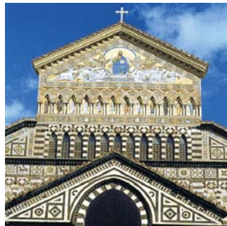
Amalfi, Detail Domfassade

dieser Folder wurde CO 2 - neutral hergestellt