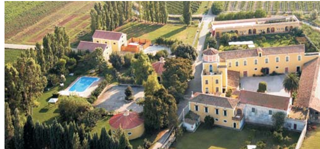
Unsere Agriturismo-Unterkunft nahe des Cilento ist dieses historische Landgut